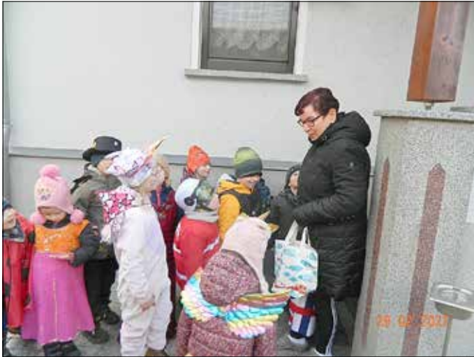
Vielen Dank an alle, die halfen, unsere Zamperdosen zu füllen!